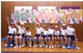
スポーツフェスタ

などの工夫をしています。「できる人が、できる時に協力する」ことを motto に、役割に関係なく活動しています。スポーツフェスタ（地域や高齢者を招待して行う運動