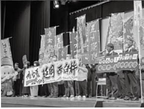
延岡西白杵キャラバン隊