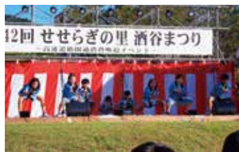
せせらぎの里酒谷まつり