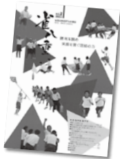
「西池」 宮崎市立 西池小学校